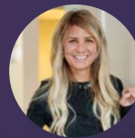
Dr. Molly Brown

Sport-Chiropraktiker Gründer der Advanced Muscle Integration Technique (AMIT)-Methode Ehemaliger Berater des US-Skiteams, NBA AMIT Klinik - Utah / USA Buhler Klinik für Sportverletzungen - Salt Lake City / USA