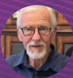
Dr. Craig F. Buhler

Sport-Chiropraktiker Gründer der Advanced Muscle Integration Technique (AMIT)-Methode Ehemaliger Berater des US-Skiteams, NBA AMIT Klinik - Utah / USA Buhler Klinik für Sportverletzungen - Salt Lake City / USA